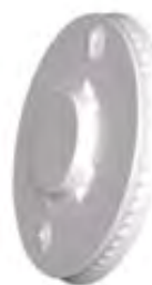
Tapa Convencional para Bebida Fría